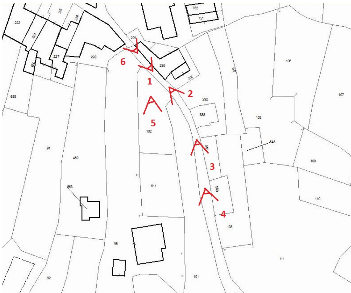
Punti di presa